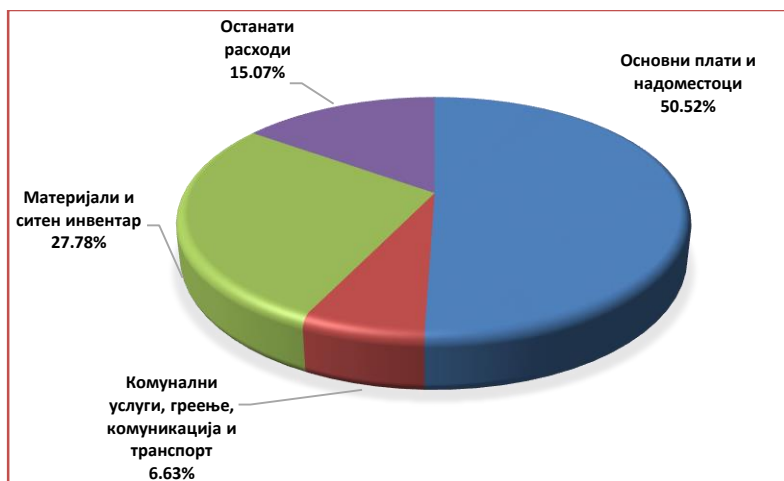
Графички приказ на структурата на реализирани расходи на ЈЗУ во период 01.01-31.08.2018 година